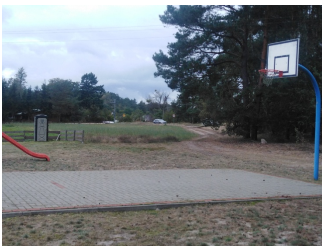
Altana i boisko na placu rekreacyjnym