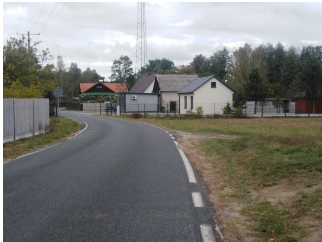
Droga wojewódzka prowadząca do miejscowości i przebiegająca przez centrum