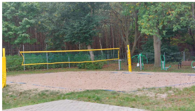
Boisko do siatkówki wraz z siłownią zewnętrzną