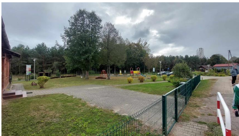
Teren rekreacyjny przy przedszkolu