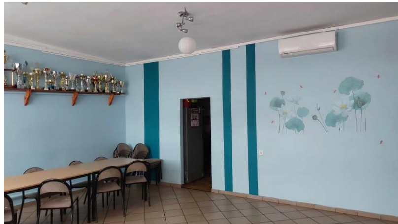
Wnętrze świetlicy wiejskiej w Kawczynie