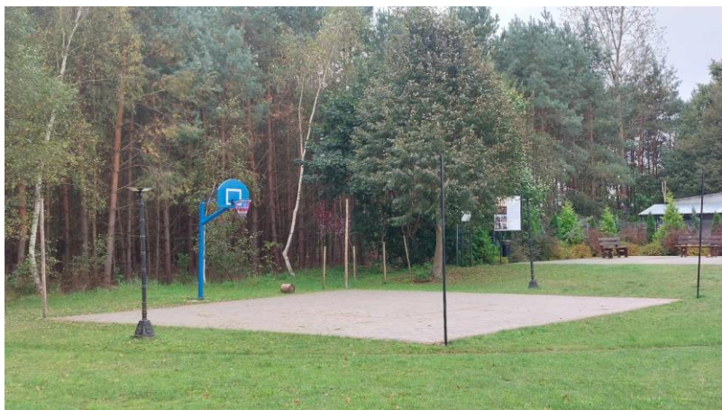
Boisko do koszykówki