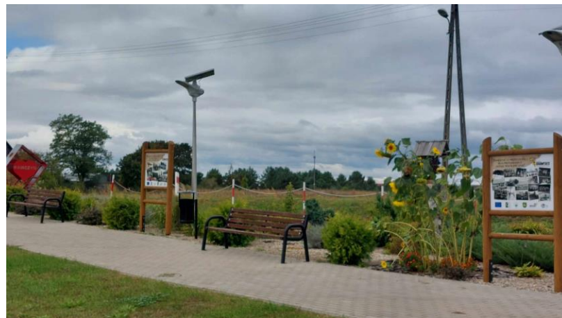
Skwer w centrum wsi wraz ze ścieżką edukacyjno-historyczną