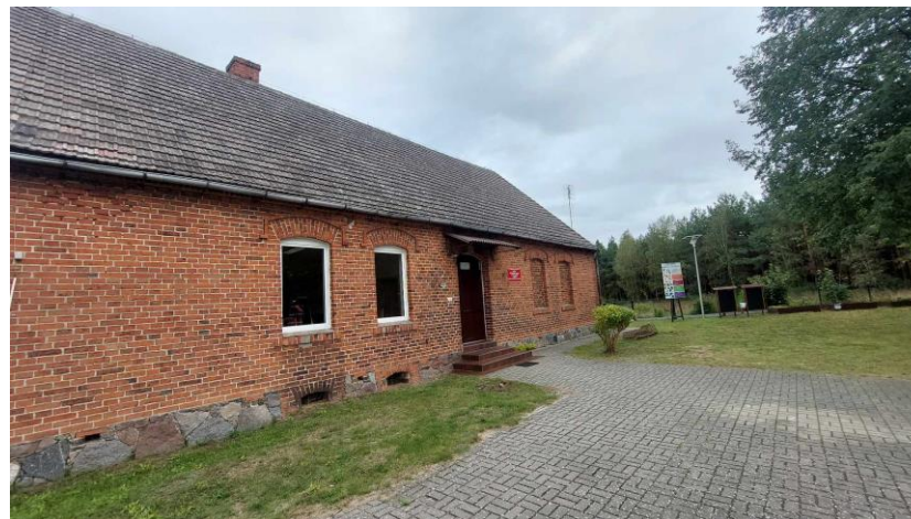
Oddział przedszkolny pn. „Muchomorki w Kawczynie