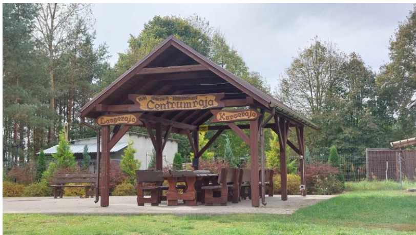
Wiata integracyjna pn. Centrumraja