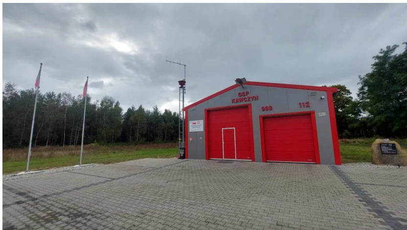
Remiza OSP w Kawczynie