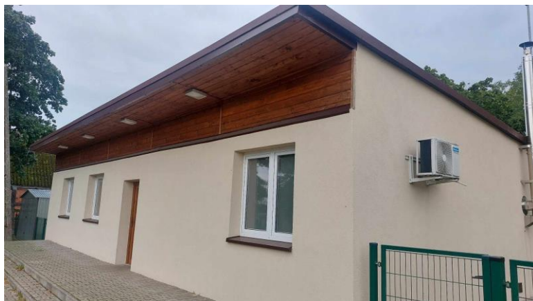
Budynek świetlicy wiejskiej