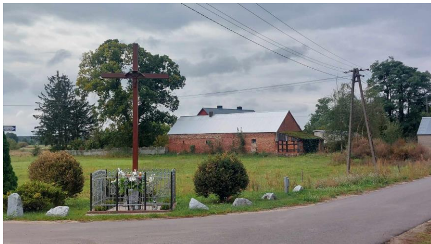
Miejsce kultu religijnego w Pelczy