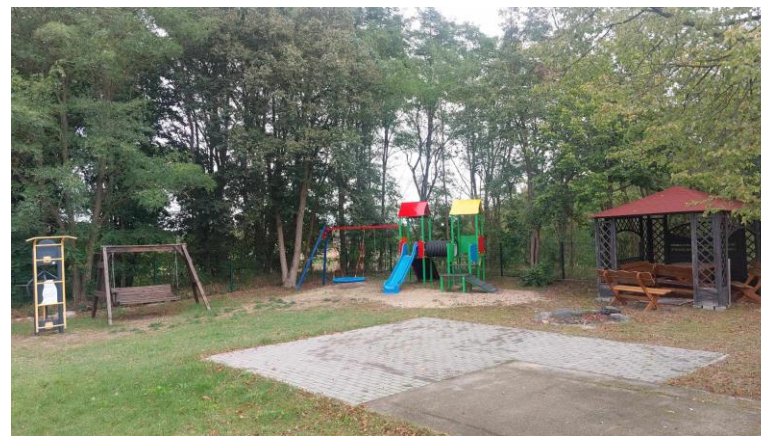
Teren rekreacyjny przy świetlicy wiejskiej