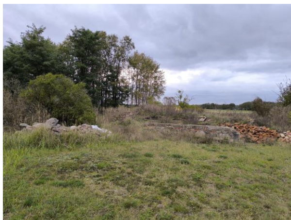
Ruiny pozostałe po szkole i kościele