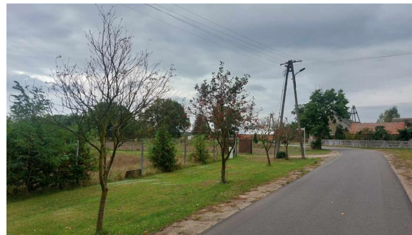
Droga gminna przebiegająca przez Pelcze