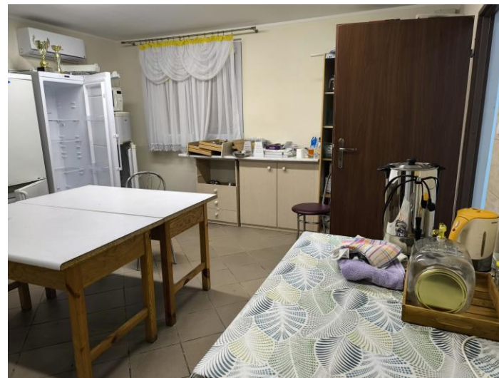
Wnętrze świetlicy wiejskiej w Pelczy