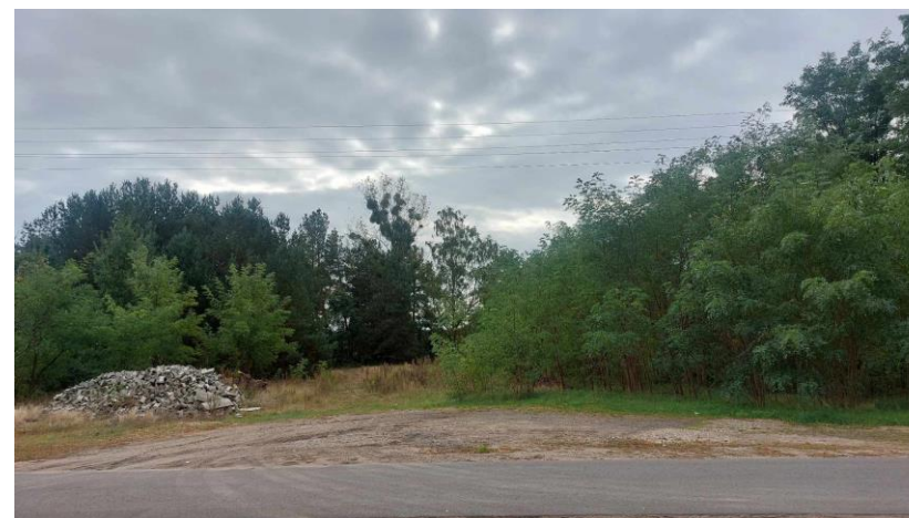
Teren naprzeciwko sali wiejskiej- do zagospodarowania