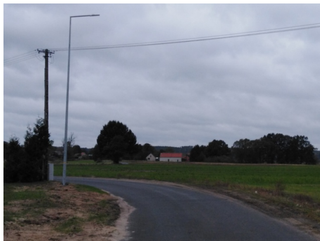
Droga gminna prowadząca do miejscowości i przebiegająca przez centrum