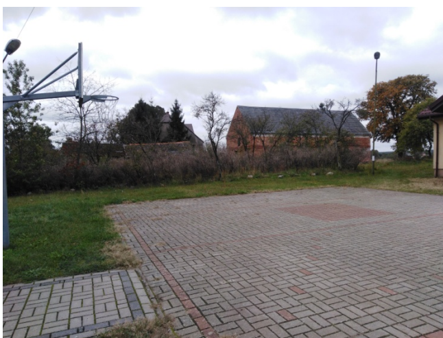
Altana i boisko na placu przy świetlicy