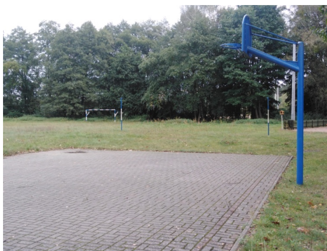
Boisko do koszykówki