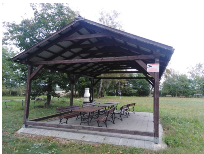
Altana na placu rekreacyjnym