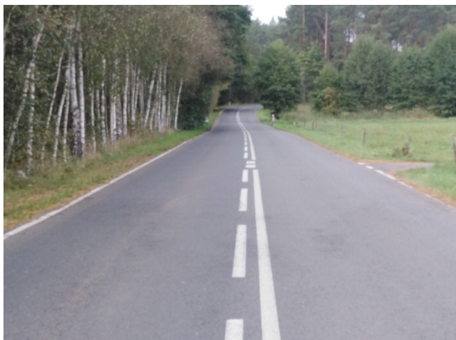
Droga wojewódzka prowadząca do miejscowości