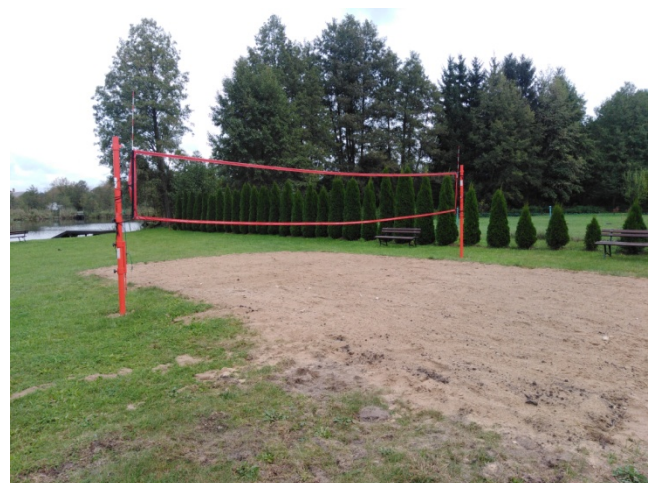
Przystań na rzece Miałą